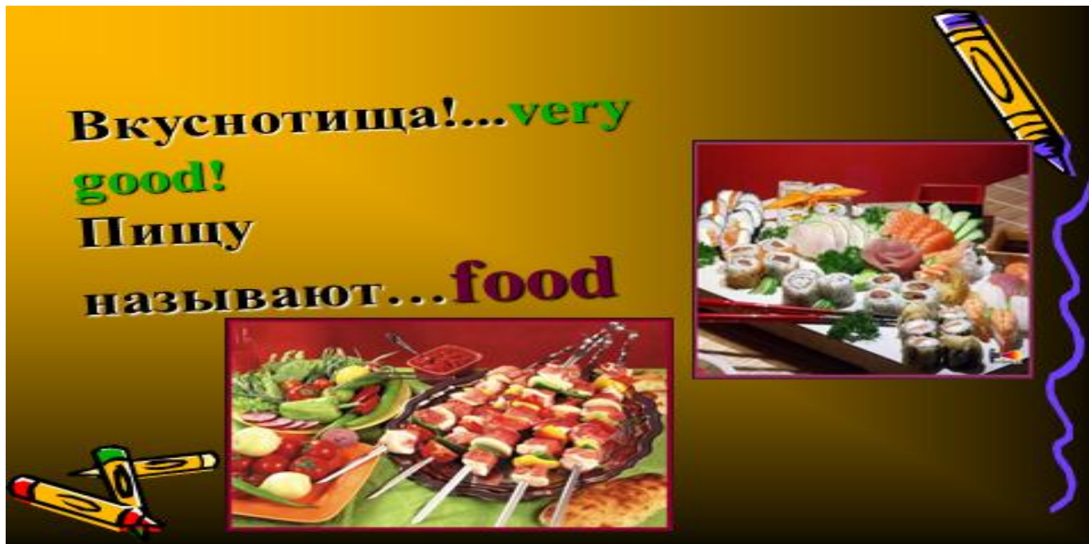
Приложение 1 (слайды из презентации)